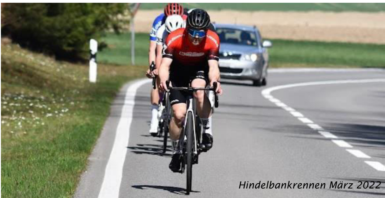
Hindelbankrennen März 2022