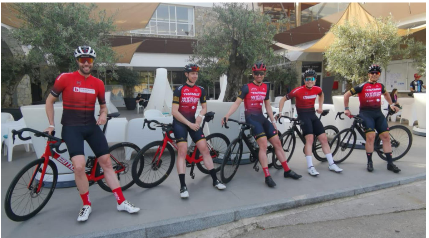
Trainingslager 2022, Giverola (E), „Die ambitionierten“