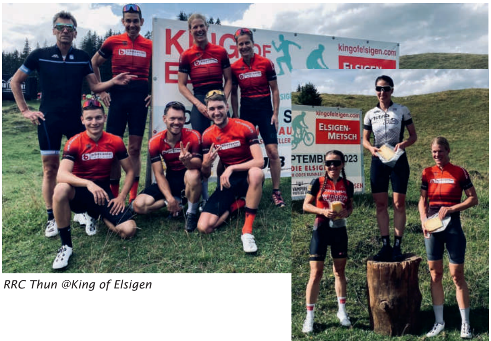
RRC Thun @King of Elsigen