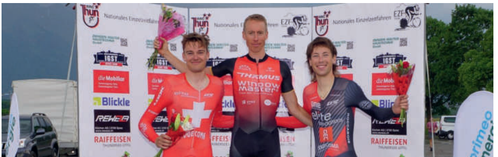
15. Nat. EZF 04.06.2023: Start, Unterwegs, die Tagessieger, www.ezf-thun.ch