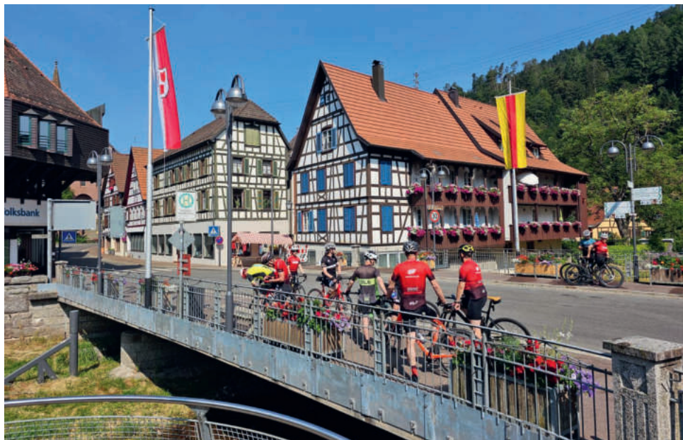
Zwischenhalt auf der Schwarzwaldtour