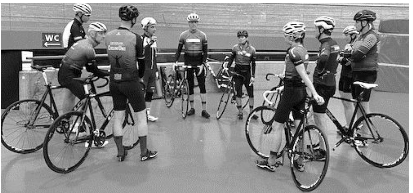
Mit dem RRC Thun unterwegs: an Radrennen, auf Trainingsfahrten, beim Bahnfahren...